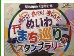
めいわまち巡りスタンプラリー