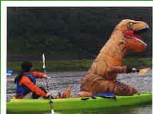
R5.10.9(月・祝) TAME池×フェスティバル

明和町では義援金箱を役場玄関、社会福祉協議会、中央公民館、総合体育館、ふるさと会館に設置しています。