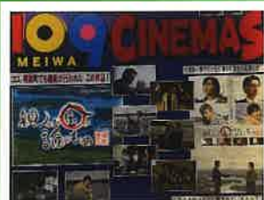
親のお金は誰のもの 法定相続人