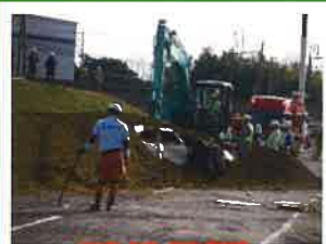
R5.10.29(日) 道路啓開訓練