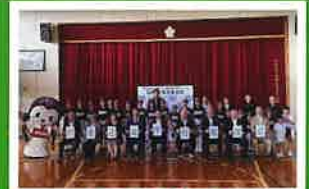
R5.10.1(日) 修正集学校開校式・楽集祭