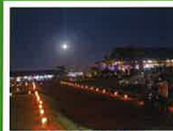
R5.9.29(金) 第二十回いつきのみや観月会