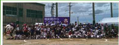
R5.8.30(水) 明和町からプロ野球の世界へ